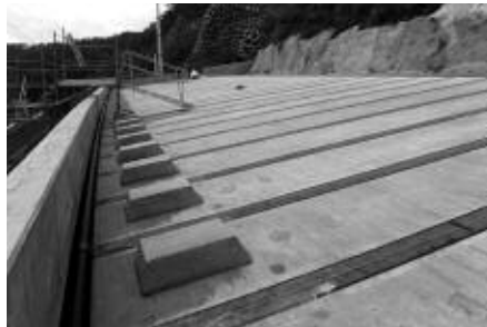
屋根上にて中津川方面を望む

西置賜道路計画課からのお知らせは、今回を持って最後になります。これまでの通行規制に対しご協力をいただきましてありがとうございました。