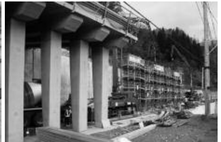
手ノ子方面を望む